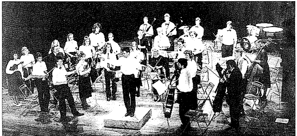
La jeunesse musicale européenne se retrouve en Saintonge

L'entrée à tous ces concerts est de 50 francs; gratuit pour les moins de 15 ans. Le concert de clôture, samedi 24 juillet à 18 heures à l'église de Jonzac, sera gratuit.